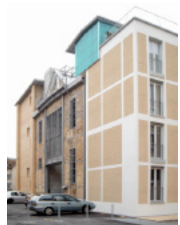
Lokomotive Winterthur Knapkiewicz & Fickert