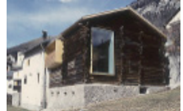
Umbau Ardez Beat Consoni