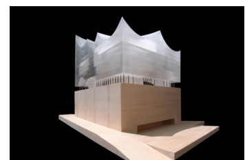
Modell: Elbphilharmonie Herzog & De Meuron