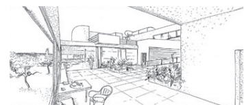
Skizze: Villa Savoye Le Corbusier