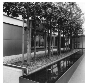
Gartenarchitektur Dieter Kienast