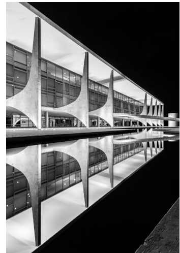
Palácio do Planalto Oscar Niemeyer