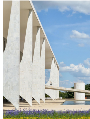
Palácio do Planalto Oscar Niemeyer

Wir wünschen Ihnen viel Erfolg. Juni 2024, die Kurskommission