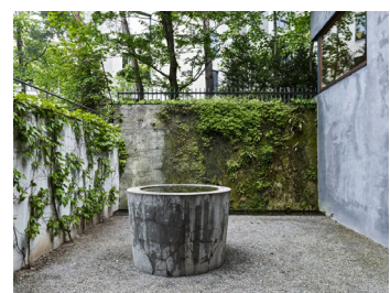
Gartenarchitektur Dieter Kienast